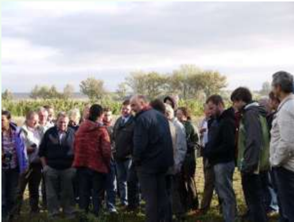
Großfahner - KUP

Wachstumsgeschwindigkeit unterschiedlicher Anbausysteme.