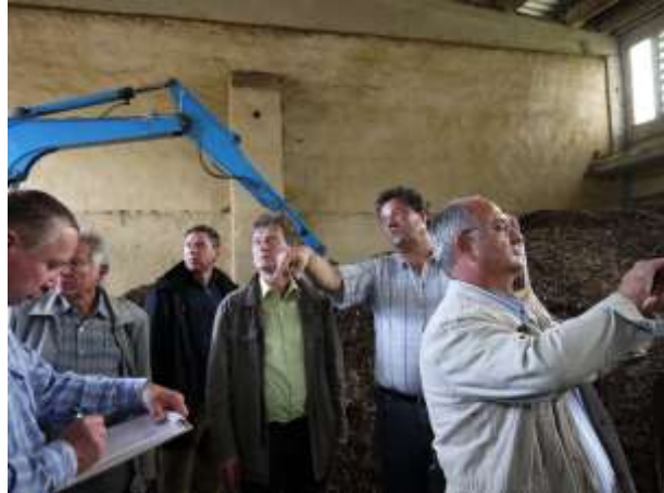
Großjena - Landschaftspflegematerial