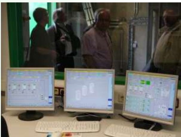
Sondershausen - Biomasseheizanlage

der Holzhackschnitzelkessel ein, der mit naturbelassenem Holz aus dem Stadtforst 830 kW